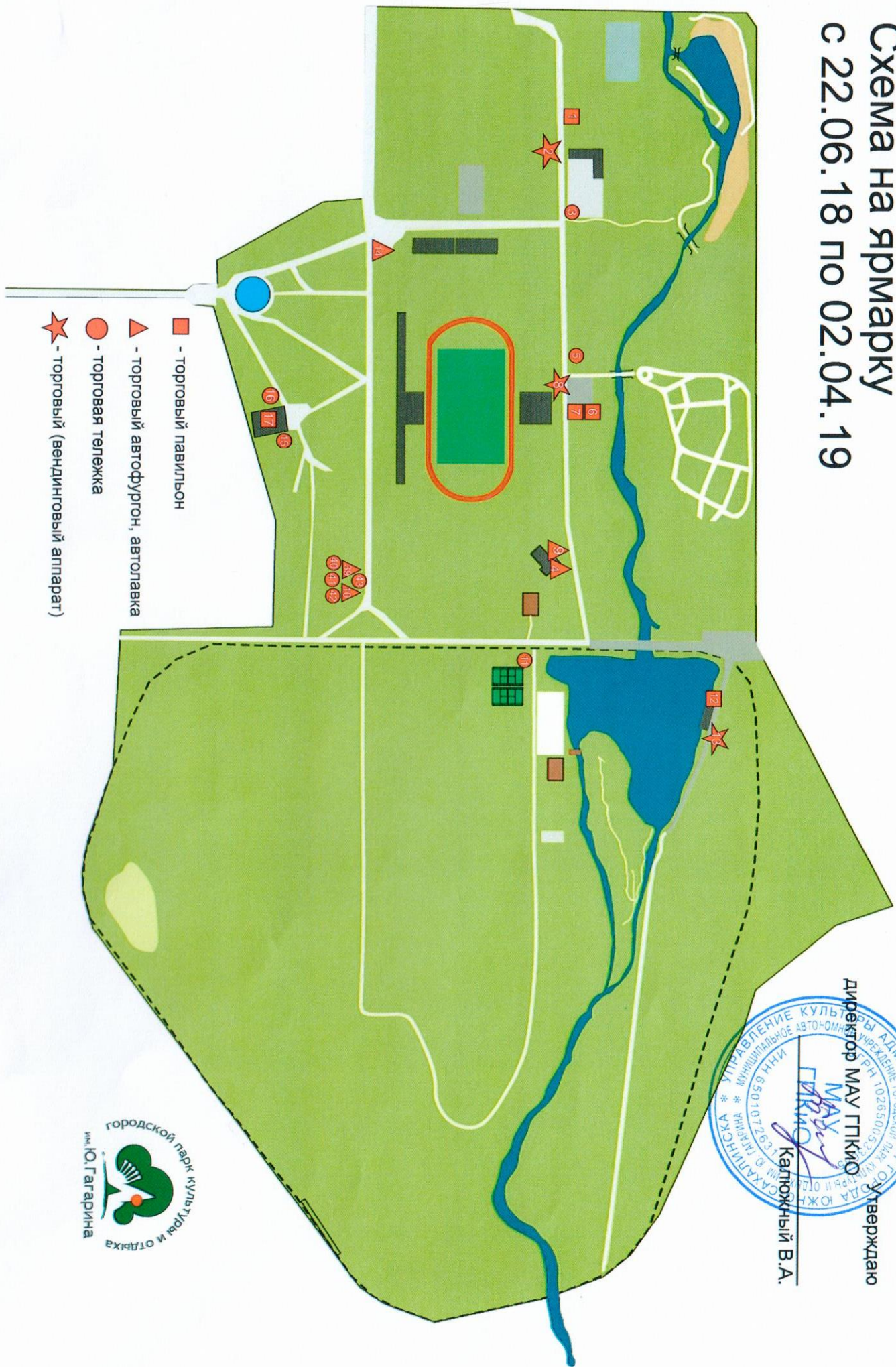
Схема на ярмарку с 22.06.18 по 02.04.19